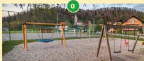
Športni park Ihan