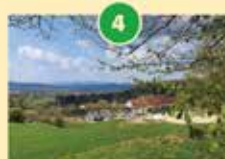
Brdo pri Ihanu